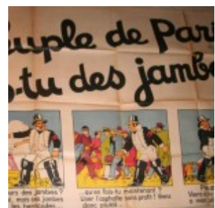
Vin du Postillon. Peuple de Paris as-tu des jambes ?