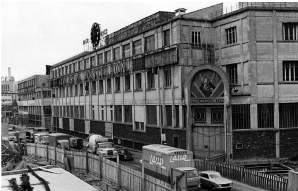
Les anciens chais des Vins du Postillon à Ivry.

À la veille de la Première Guerre Mondiale, les vins de la Maison Gerbaud avaient acquis une solide réputation jusqu'à Paris. Antoine Gerbaud, le fils du fondateur, vend l'affaire à Antoine Combastet , un corrézien monté à Paris. La nouvelle société, d'abord "Ancienne Maison Gerbaud" fusionna ensuite avec "La Vinicole" basée à Charenton, puis avec "Les vins des Trois Comètes".