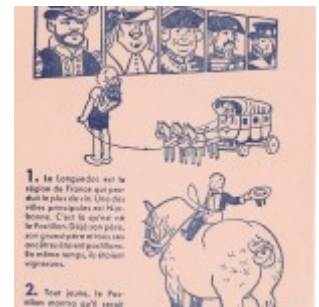
Buvard. Histoire du Postillon.