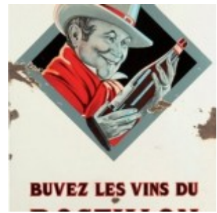
Vin du Postillon. Buvez les vins du Postillon.