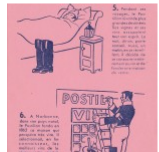
Buvard. Histoire du Postillon.