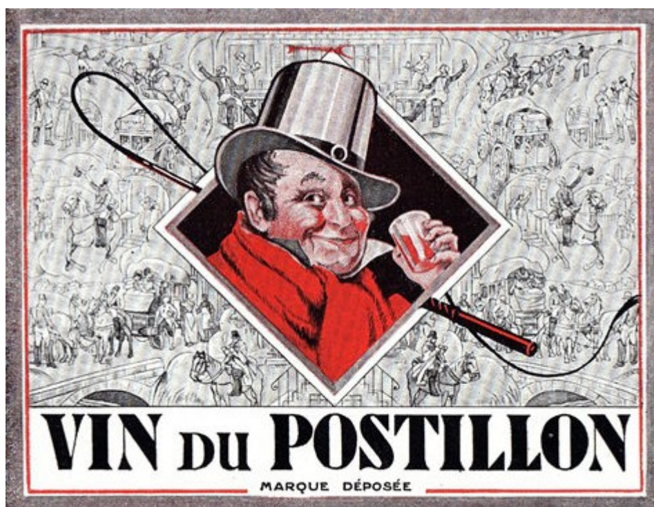
Le Vin du Postillon.