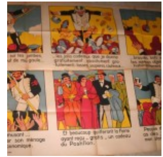
Vin du Postillon. Peuple de Paris as-tu des jambes ? 2