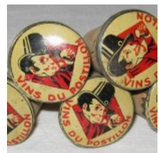
Vin du Postillon. Bouchons publicitaires.