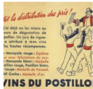
Vin du Postillon. Bientôt la distribution des prix