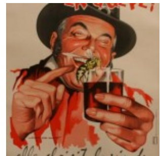
Vin du Postillon. Pas folle la guêpe.